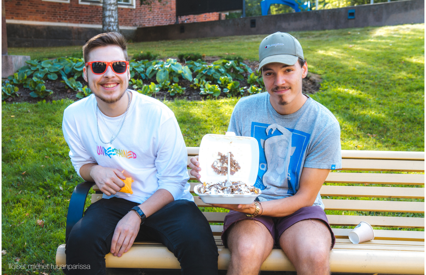
Illoiset miehet ruuanparissa